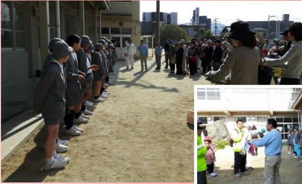
【西小学校児童ガイドの紹介】