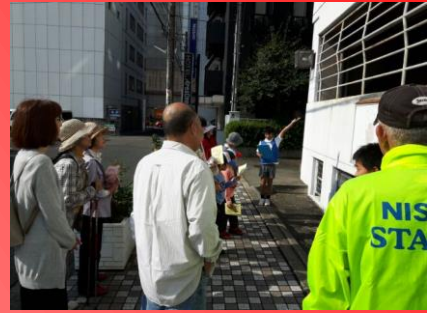
【①三之丸市営駐車場】 福山城外堀の石垣が保存されています