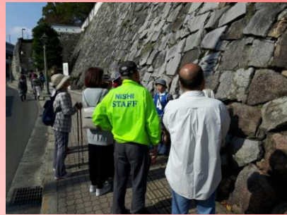
【④空襲の傷跡】 石垣が焼かれて変色しています