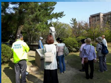
【⑧水野勝成像前にて】