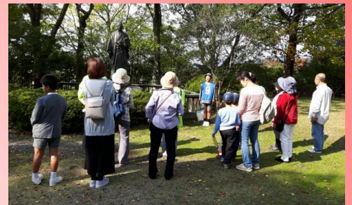
【⑩阿部正弘像前にて】