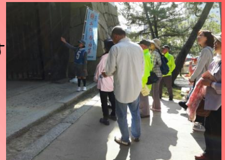
【⑤筋鉄御門】 国重要文化財