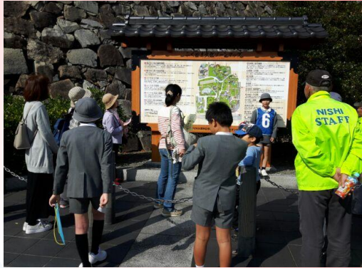
【③ふくやま文化ゾーンマップ】