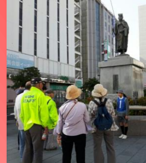
【②釣人像前にて】 平櫛田中 作です