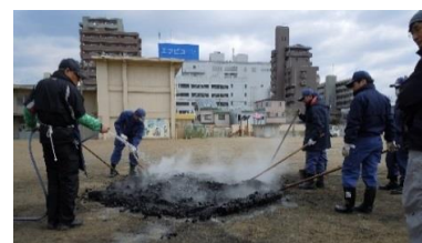
火の後始末も忘れずに

「とんど焼き」とは、年の初めに1年の災厄を祓うという意味がこめられたお祭りだそうです。舞い上がる火煙とともに、正月の神様が帰られるとされていて、この火にあると1年間健康で過ごせるという言い伝えがあります。燃やした書き初めの紙が高く舞い上がると習字が上手になるとも言われています。