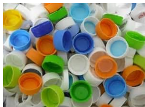
公民館で集められた ペットボトルキャップ